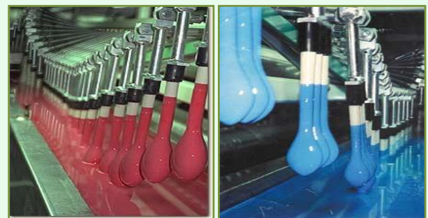
รูปที่ 2 ตัวอย่างการจุ่มแม่พิมพ์ลงในน้ำยาง