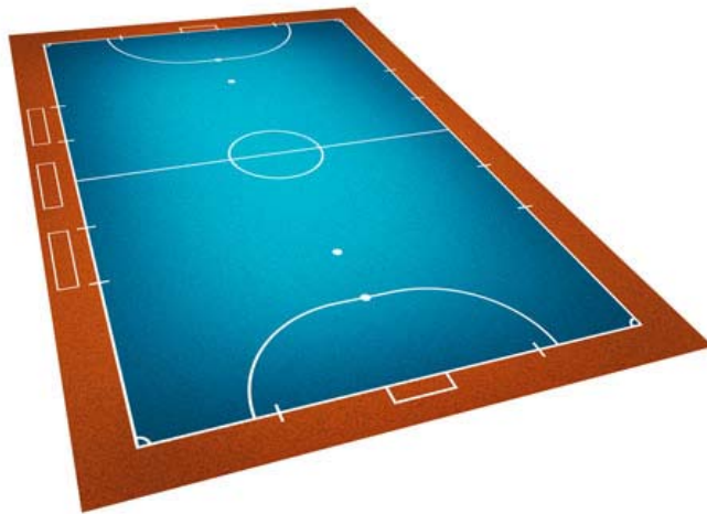
รูปที่ 1 พื้นสนามฟุตซอล Futsal Arenas ตามมาตรฐานของสหพันธ์ฟุตบอลนานาชาติ (FIFA)

มาตรฐานแผ่นยางปูสนามฟุตซอล (มอก.2739-2559) เป็นมาตรฐานผลิตภัณฑ์ที่ครอบคลุมเฉพาะแผ่นยางปูสนามฟุตซอลที่ทำจากยางธรรมชาติหรือยางสังเคราะห์หรือยางธรรมชาติเคลือบด้วยวัสดุสังเคราะห์อื่นๆ ซึ่งไม่รวมถึงการออกแบบและการติดตั้งแผ่นยางปูสนามฟุตซอลและสนามฟุตซอล โดยมาตรฐานแผ่นยางปูสนามฟุตซอล สนามแข่งขันฟุตซอลตามมาตรฐานสหพันธ์ฟุตบอลนานาชาติ (FIFA) ต้องเป็นรูปสี่เหลี่ยมผืนผ้า ความยาวเส้นข้างต้องยาวกว่าความยาวเส้นประตู โดยสนามมีความยาวต่ำสุด 25 เมตร สูงสุด 42 เมตร ความกว้างไม่น้อยกว่า 15 เมตร และสูงสุด 25 เมตร