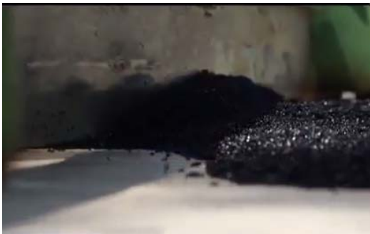
การเทเม็ดยางปูพื้นสนาม

ในการทำแผ่นยางปูสนามฟุตบอลเริ่มต้นด้วยการเตรียมพื้นผิวสนามโดยการฉีดน้ำด้วยเครื่องฉีดน้ำแรงดันสูง ทำความสะอาดพื้นให้สะอาดปราศจากฝุ่น จากนั้นลงสารกันซึมและสารรองพื้นให้ทั่วทั้งสนาม นำเม็ดยางปูพื้นสนาม (ตาม มอก. 2682-2558) ที่ผสมสารยึดติดเกลี่ยให้ทั่วผิวหน้าสนาม จากนั้นจึงนำยางและสารเคมีเหลวที่ผสมเสร็จแล้วมาโรยให้ทั่วพื้นผิวสนาม เพื่อปรับความนิ่มของสนาม แล้วทาสารเคลือบ เช่น อีพอกซีหรืออะคริลิก ให้ทั่วพื้นสนามเพื่อให้พื้นสนามมีความทนทานต่อสภาพอากาศ และตีเส้นตามมาตรฐานด้วยสีอะคริลิก 100% ตามชนิดของสนามกีฬา ทำให้ได้สนามฟุตบอลตามมาตรฐานสากล ดังรูปที่ 4