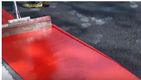
เทคอมพาวด์เหลว