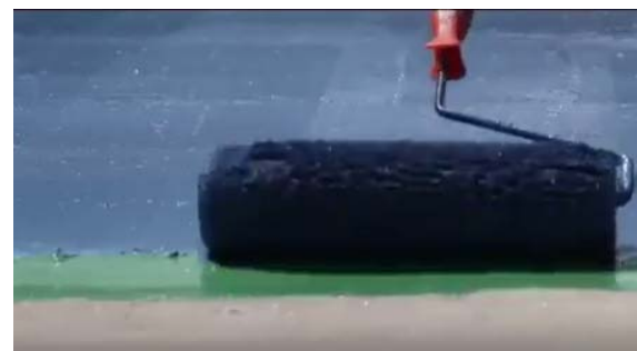
เกลี่ยสารเคมีให้ทั่วผิวสนาม