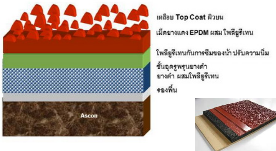
รูปที่ 3 การปูพื้นสนามประเภทหลายชั้น