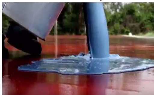
ทาสารเคลือบป้องกัน