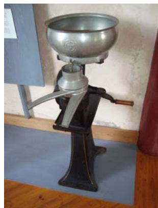
รูปที่ 2 เครื่องทำน้ำนมแบบต่อเนื่อง