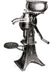
1919 De Laval hand cream separator; automatically oiled and possessing all other latest improvements.