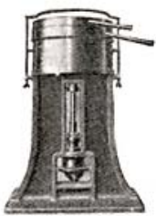
First practical De Laval cream separator—introduced in 1878.

ในช่วงปี ค.ศ. 1878 โดย Carl Gustaf Patrik De Laval ได้ประดิษฐ์เครื่องแยกนมออกเป็นครีมและสกีมอย่างต่อเนื่อง (ดังรูปที่ 1 และ 2) ซึ่งเครื่องนี้ได้ก่อให้เกิดการพัฒนาอุตสาหกรรมนมอย่างใหญ่หลวงและได้มีการนำเครื่องนี้มาใช้ในอุตสาหกรรมน้ำยาล้างเพื่อใช้แยกน้ำยาล้างส่วนที่เป็นครีมและสกีมออกจากกัน เนื่องจากน้ำนมและน้ำยาล้างเป็นคอลลอยด์ (colloid) เหมือนกัน โดยน้ำยาล้างจะมีอนุภาคขี้ผึ้งที่มีประจุลบและมีขนาดเล็กกระจายตัวอยู่ในน้ำ