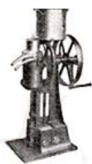
First De Laval "Hollow Bowl" hand cream separator — introduced in 1885.