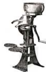
The First De Laval Tangential Slot "Split-Wing" Tubular Shaft hand cream separator — introduced in 1910.