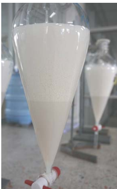
รูปที่ 3 การแยกชั้นของน้้ายางข้นชนิดครีม

ต่อมาในปี ค.ศ. 1927 Naugatuk Chemical Company ได้จดสิทธิบัตรให้สาร pectin, Irish moss และ karata gum เป็นสารก่อครีม ในปี ค.ศ. 1927 ได้มีการจดสิทธิบัตรสาร sodium alginate เป็นสารก่อครีมโดยบริษัท General Rubber Company นอกจากนั้นยังมีการจดสิทธิบัตรสารก่อครีมเพิ่มเติม เช่น สาร locust bean gum โดย RPRA ในปี ค.ศ.1934 และ methyl cellulose โดย United State Rubber Co., Ltd. ในปี ค.ศ.1935 และแบ่งจากเมล็ดมะขามโดย RPRA ในปีค.ศ.1936 จนกระทั่งในปี ค.ศ. 1937 ได้มีการจดสิทธิบัตรของสารก่อครีมที่หลากหลาย เช่น polyacrylate, polyvinyl alcohol, kayaku flour, pectates และอื่นๆ ซึ่งสารก่อครีมแต่ละชนิด