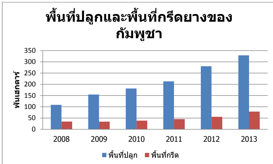
รูปที่ 2 พื้นที่ปลูก-พื้นที่กรีดยางของกัมพูชา