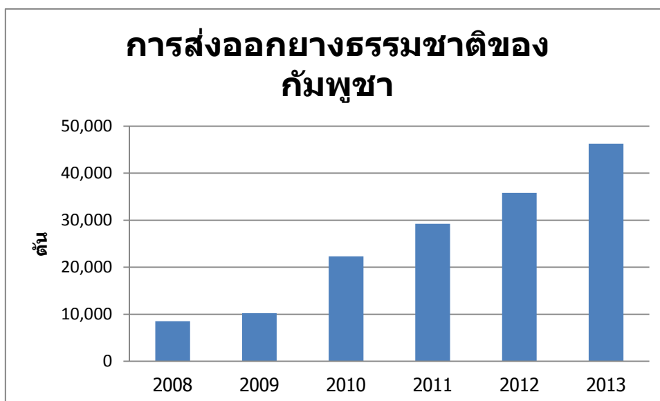
รูปที่ 4 การส่งออกยางธรรมชาติของกัมพูชา