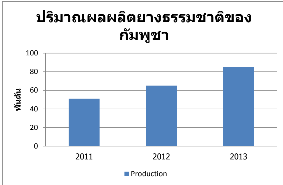
รูปที่ 1 ปริมาณผลผลิตยางธรรมชาติของกัมพูชา