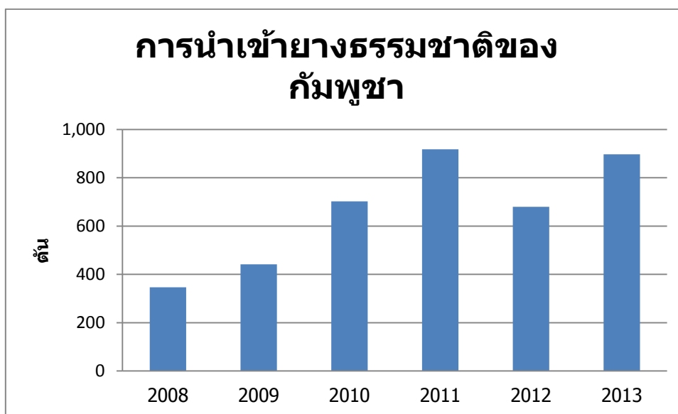
รูปที่ 3 การนำเข้ายางธรรมชาติของกัมพูชา